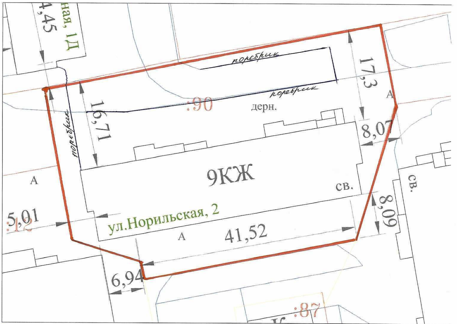
Схема земельного участка многоквартирного жилого дома № 2 по ул. Норильской Площадь земельного участка S = 2343 \text{ м}^2

S асфальтировки - 1556 \text{ м}^2 S асфальтировки отмостки - 116 \text{ м}^2 поробрик демонтаж - 79,65 \text{ м} , 3,19 \text{ м}^3 поробрик монтаж - 99,6 \text{ м} , 12,75 \text{ м}^3